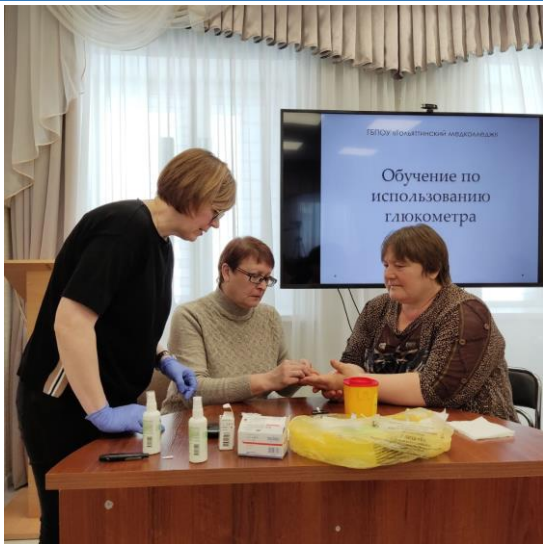
Выездной обучающий семинар медицинского колледжа