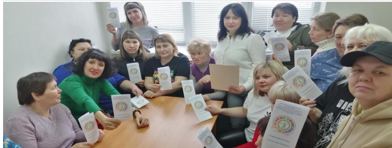
Обсуждение основных принципов здорового образа жизни