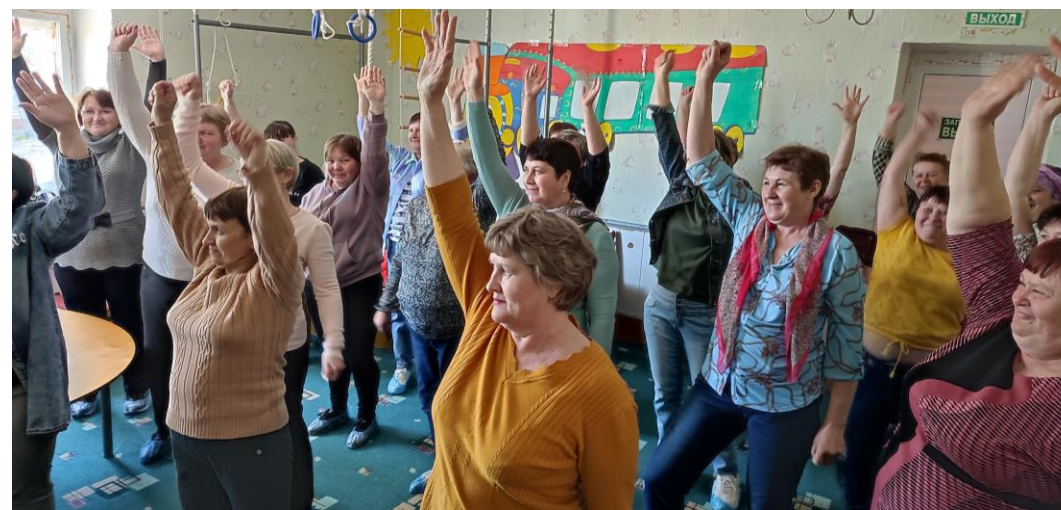
Тренинг по профилактике эмоционального выгорания