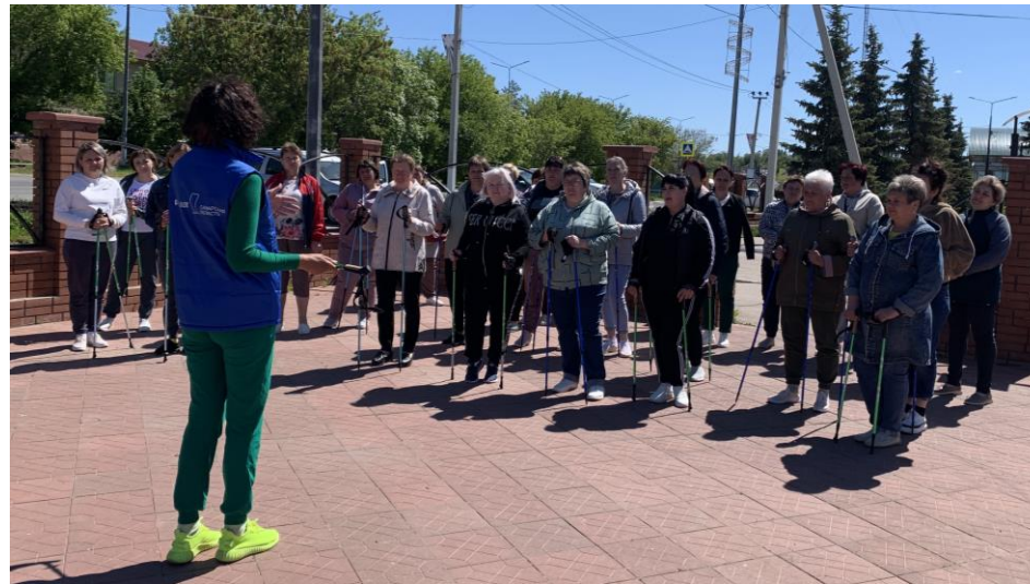
Мастер-класс по северной ходьбе