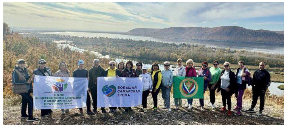
Пешая прогулка по большой Самарской тропе