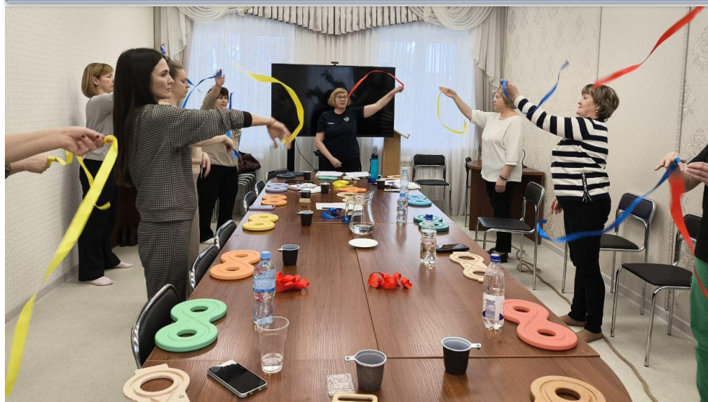
Семинар «Кинезиология. От стресса к гармонии»