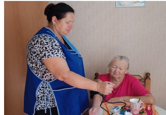
Измерение артериального давления