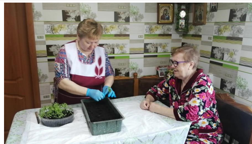
Участие добровольцев в благотворительной акции