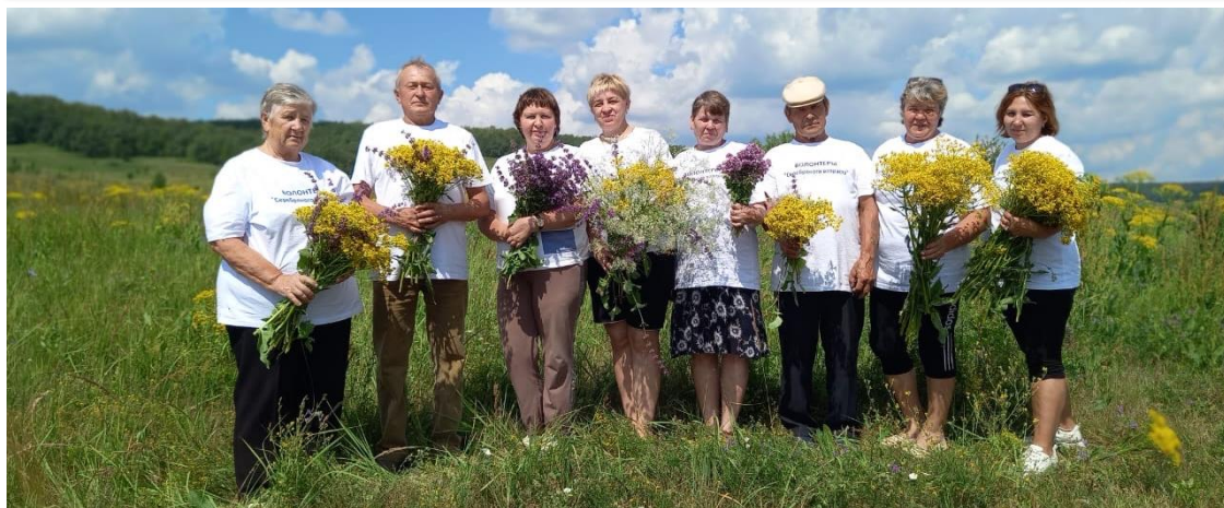
Корпоративное мероприятие для добровольцев «Пикник для здоровья!»