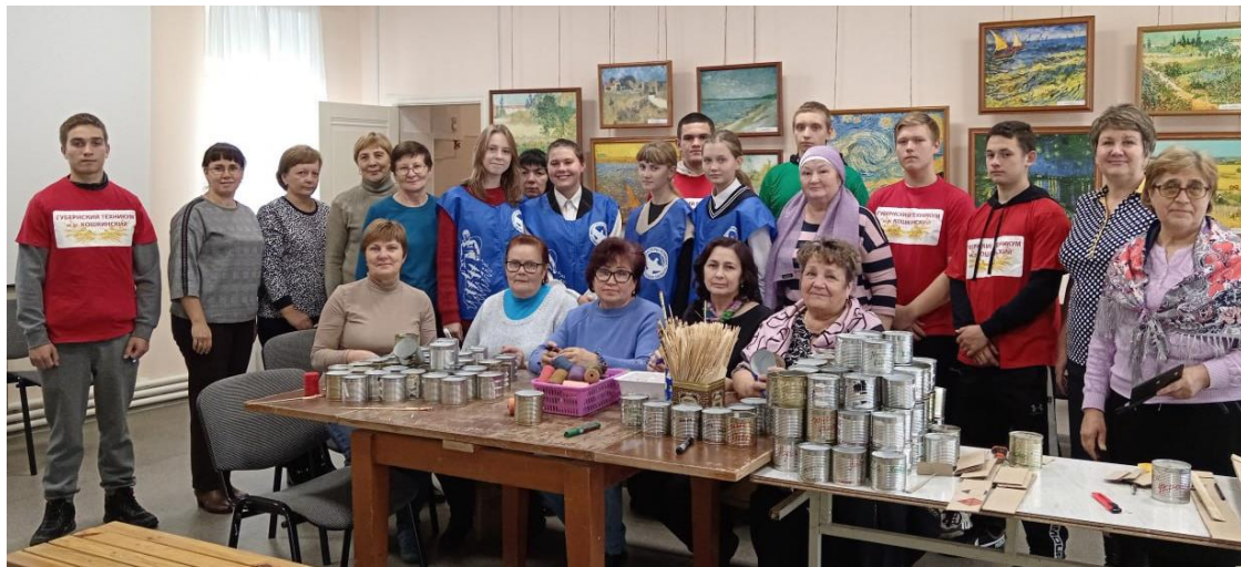
Участие корпоративных добровольцев в изготовлении окопных свечей

Модуль «Мы Вместе!». Развитие корпоративного добровольчества для повышения социальной активности социальных работников