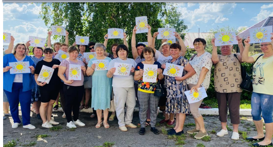
Мастер класс по арт-терапии