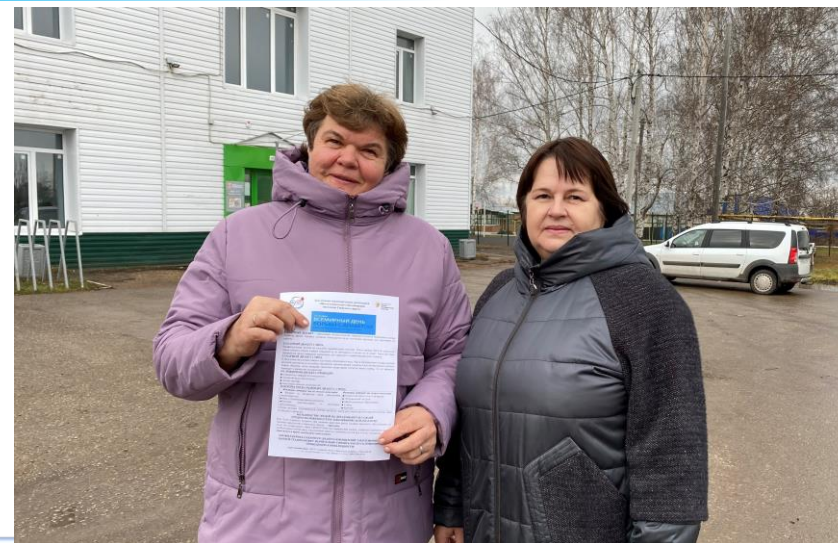
Участие добровольцев в информационной акции