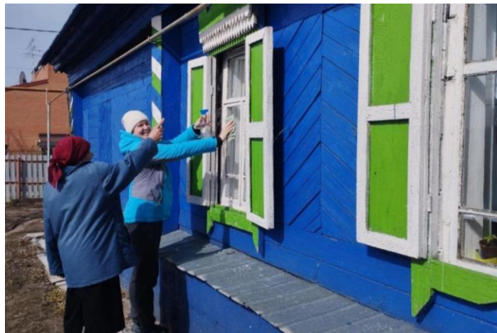
Благотворительная акция «Весенняя неделя добра»

Социальные работники в возрасте 50+, осуществляющие надомное обслуживание в малых селах