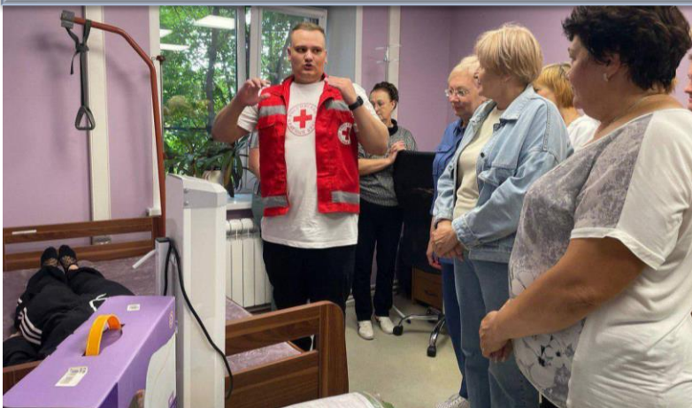
Практическое занятие по оказанию первой помощи