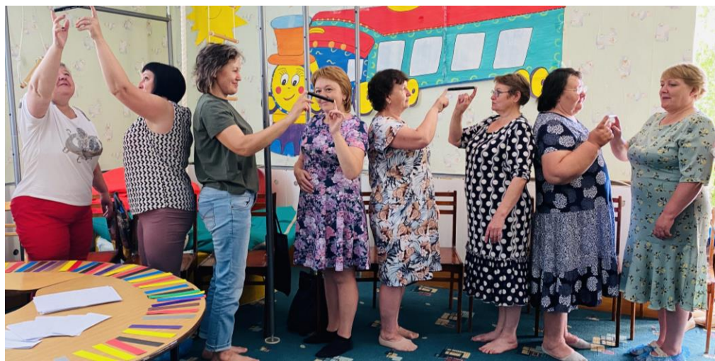
Мастер - класс «Зарядись позитивом»

Модуль «Мы в ресурсе!». Организация и проведение мероприятий по профилактике профессионального выгорания