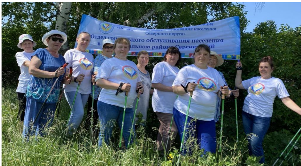
Лесные прогулки с палками для северной ходьбы

Модуль «Мы за ЗОЖ!». Организация и проведение с социальными работниками оздоровительных мероприятий