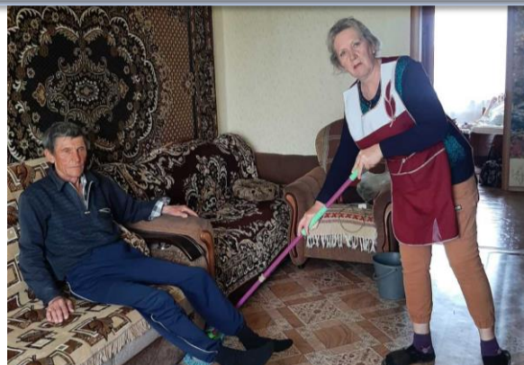
Уборка жилого помещения