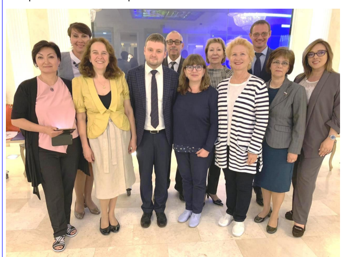
На фото — представители Волгоградского региона с членами Общественной палаты Российской Федерации.