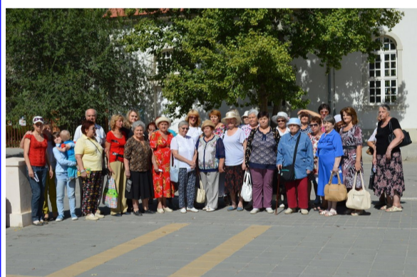
Общее фото на фоне кирхи.