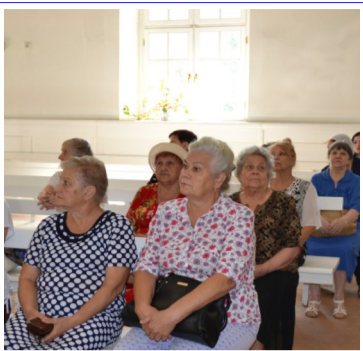
На фото: наша группа в кирхе.

МЫ БЛАГОДАРИМ НАШИХ УЧАСТНИКОВ ПОЕЗДКИ ЗА ДОБРЫЕ СЛОВА!