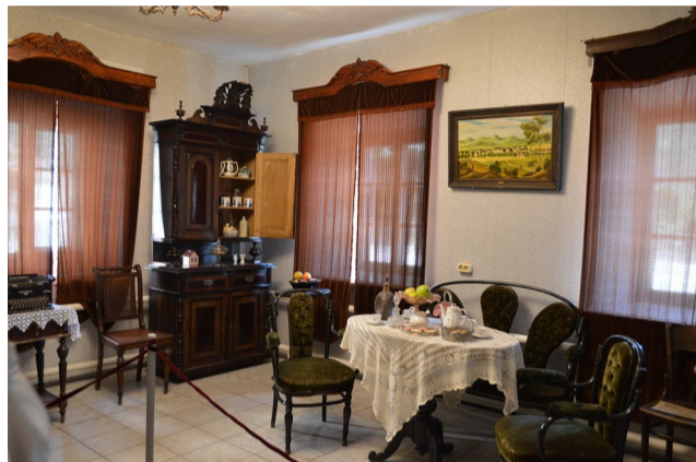
На фото: квартира аптекаря.