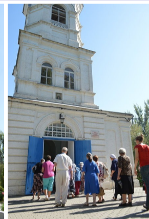
На фото: Свято-Никитская церковь 18 века.