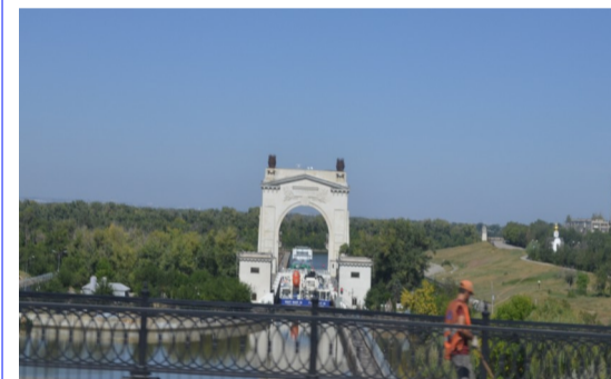
На фото: шлюзование на Волго-Донском судоходном канале.