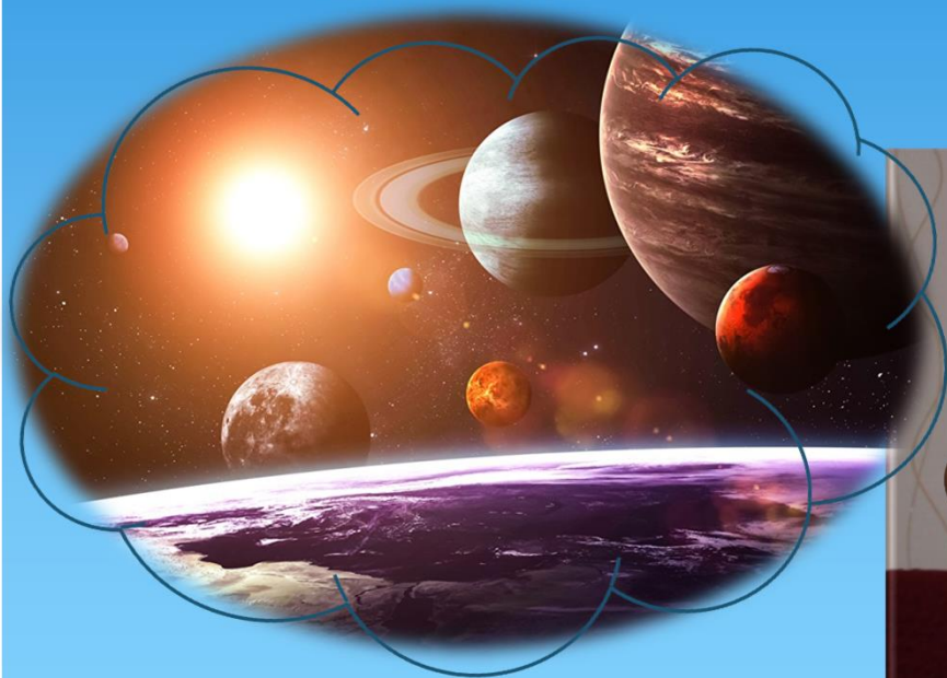
Просмотр видеоролика «Полет в космос»

Участники практики виртуально «посещают» достопримечательности своего родного города и других городов и даже стран, им дается возможность посетить природу, подводный мир, мир космоса и многое другое.