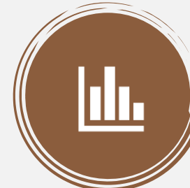
Опросник профессиональной готовности