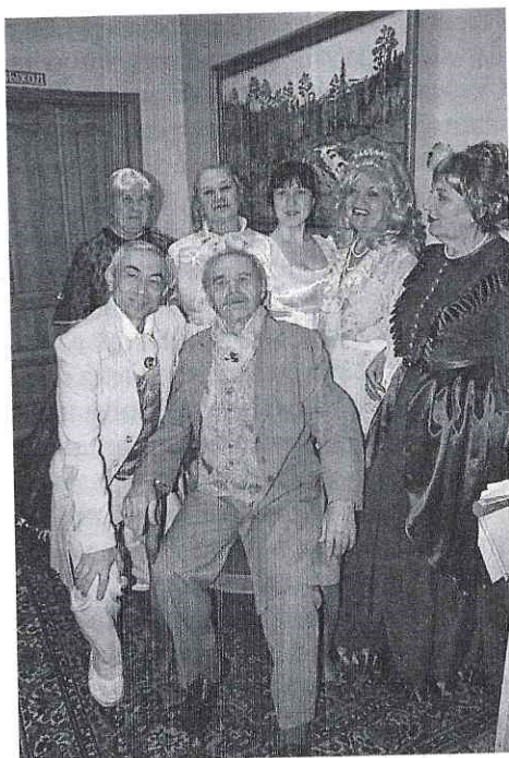
В. Соллогуб. «Беда от нежного сердца». На гастролях в с. Сухобузимское

Примером взаимопомощи может служить случай, когда одна из артисток сломала руку, — весь коллектив по очереди посещал ее на дому, помогая выполнить домашнюю работу. Под патронажем коллектива и старейшая участницам театра, справившая свое 86-летие, но сохранившая творческий потенциал. Ей