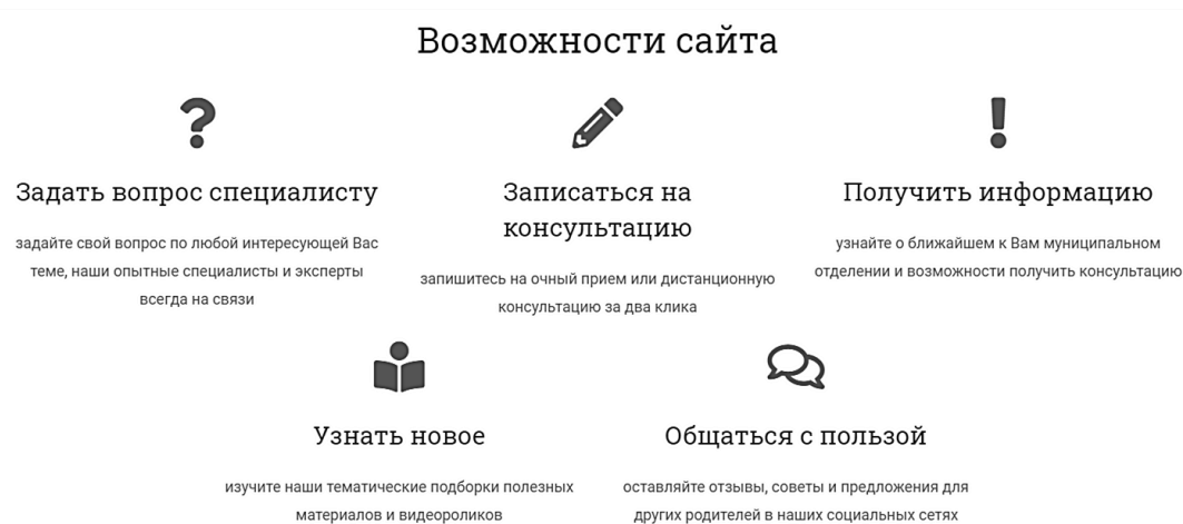
Рис. 3. Основные возможности информационно-методического сайта Регионального Консультационного Центра

Единый информационный ресурс РКЦ представляет собой информационно-методический ресурс для родителей (законных представителей) несовершеннолетних детей, на котором реализованы следующие функции (рис. 3).