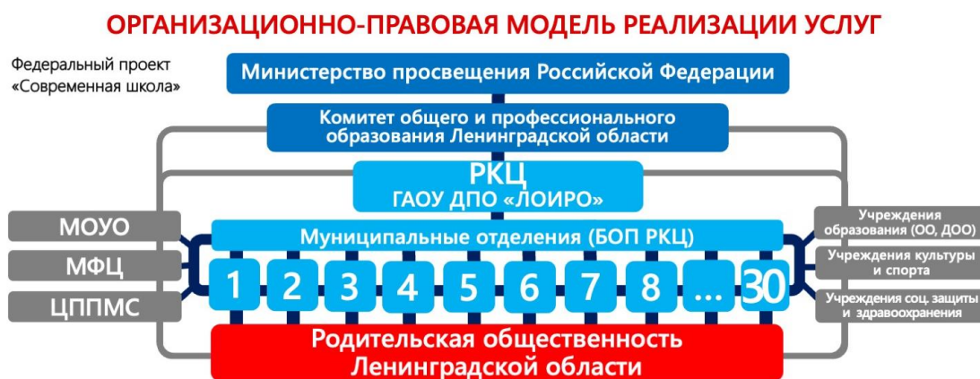
Рис. 1. Схема взаимодействия единого Регионального Консультационного Центра с вышестоящими организациями, базовыми опорными площадками, социальными партнерами и родительской общественностью

На рис. 1 представлена схема взаимодействия единого Регионального Консультационного Центра (РКЦ) с вышестоящими организациями, с базовыми опорными площадками (БОП) и социальными партнерами, родительской общественностью. Консультационного Центра (РКЦ) с вышестоящими организациями, с базовыми опорными площадками (БОП) и социальными партнерами, родительской общественностью.