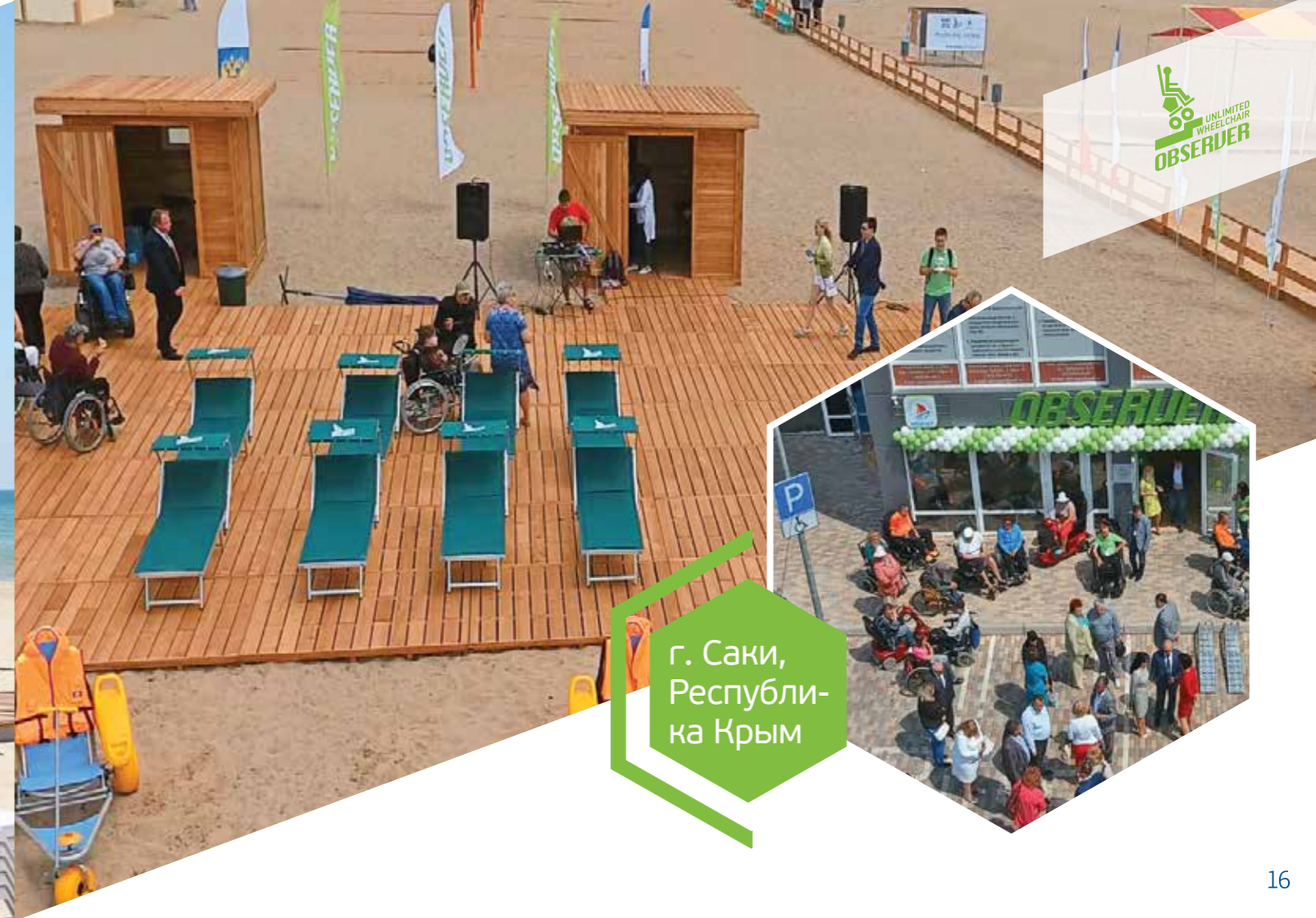
г. Саки, Республи- ка Крым