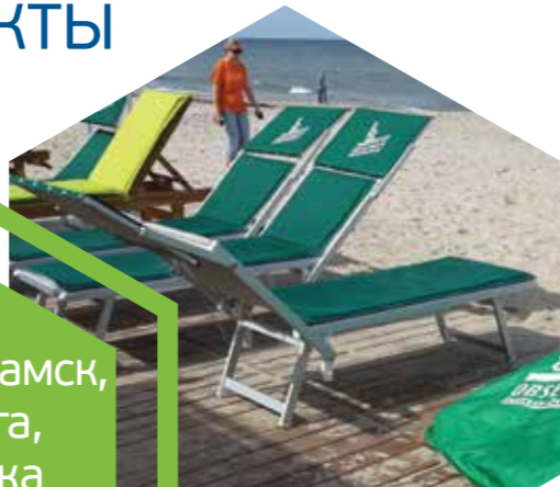
г. Нижнекамск, река Волга, Республика Татарстан