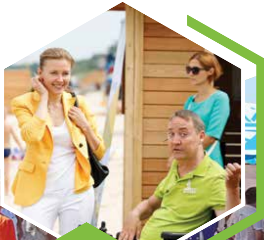
г. Анапа, Черное море, Краснодар- ский край