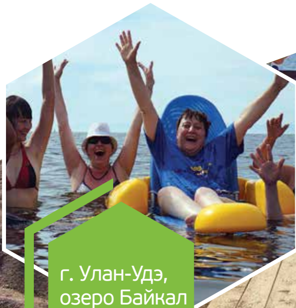
г. Улан-Удэ, озеро Байкал