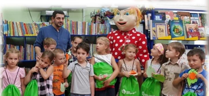
Дети-инвалиды и дети с ограниченными возможностями здоровья