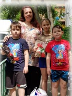
Семьи, воспитывающие детей-инвалидов