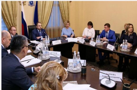
18 декабря 2018 г., Совет по кадровой политике ЯНАО в г. Салехарде