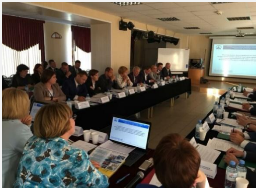
28 августа 2018 г., дискуссионная площадка в г. Новый Уренгой