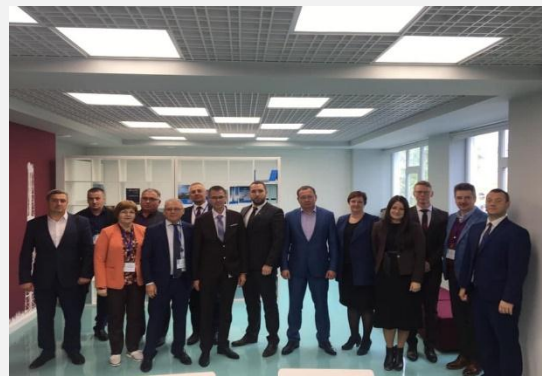
27-31 августа 2019 г., Региональное совещание педагогов в гг. Салехарде, Муравленко, Новом Уренгое